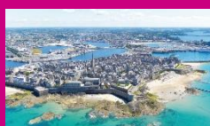
Sortie scolaire à Saint-Malo