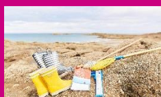
Pêche à pied avec la maison de la Baie

En 2020-2021, l'APEL a notamment participé au financement de :